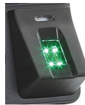
Produktvideo Datafox Flächensensor