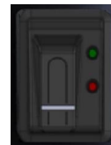
Produktvideo Datafox Zeilensensor