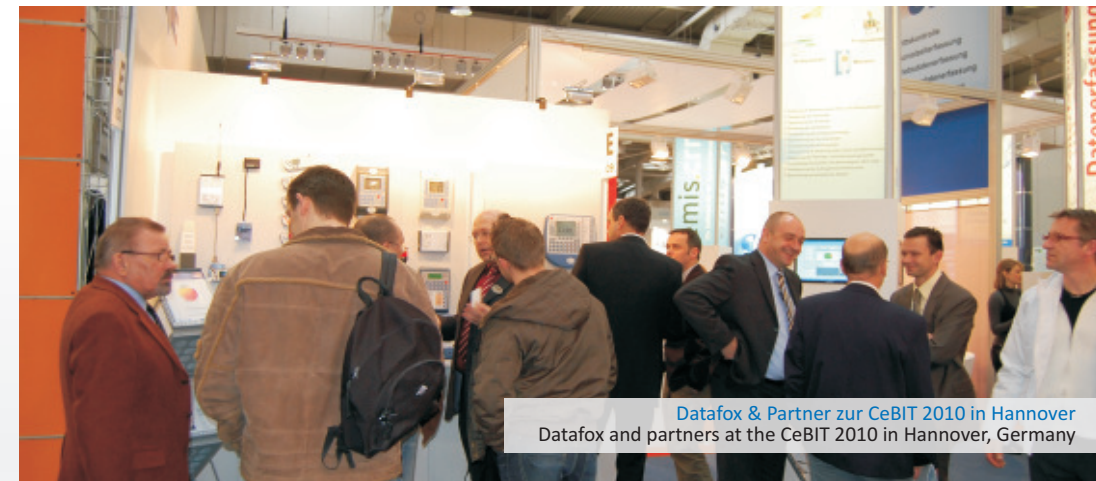
Datafox & Partner zur CeBIT 2010 in Hannover Datafox and partners at the CeBIT 2010 in Hannover, Germany

Service & Warranty With Datafox you get cost-free developer- and second level support, 2 years manufacturer's warranty and a delivery warranty of 10 years for our devices.