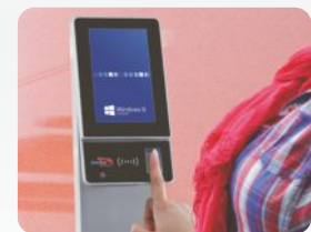
Personalzeitbuchungen mit optionalem Fingerprint. Personnel time bookings with optional fingerprint.