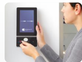
Buchung von Personalzeiten per RFID durch die Mitarbeiter. Employee booking of personnel times by RFID.

Scalable system with many additional options. You only buy that equipment which is necessary for your application. For more information visit our product sites at www.datafox.de .