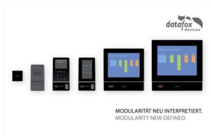
Datafox Evolution Terminals, IPCs, ZK-Leser.jpg