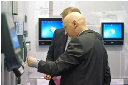
Datafox Designlinie zog viele Besucher an.jpg