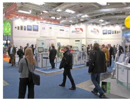
Datafox Messestand CeBIT 2013.jpg