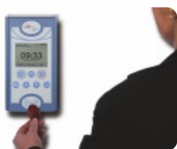
Buchung von Personalzeiten per RFID durch den Mitarbeiter Booking of staff time via RFID by the employer

Companies need to have flexible working times and a correct working time collection for a cost-effective business. This is ensured by electronic systems for time and attendance.