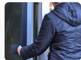
Zutrittskontrolle mit abgesetztem Datafox Zutrittsleser. Access control with external Datafox access reader.

Companies need to have more and more flexible working times and the requirement to make the organisation more economic. They also rely that only authorized people can get to respective areas. The knowledge, which person is where, when and how long at a definite place is additionally important. It can be realized by electronic systems for access control.