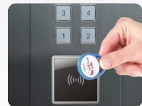
Aufzugsteuerung mit abgesetztem RFID-Leser. Elevator control with external RFID reader.