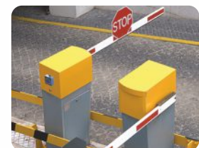
Lösung an einer Schranken-anlage mit Zutrittsicherheit. Solution at a barrier construction with access control.