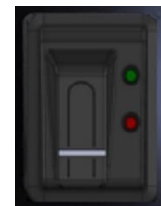
Produktvideo Datafox Zeilensensor