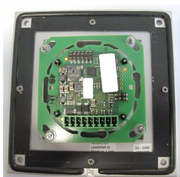
Ansicht Rückseite (Abstand Leseinheit – Blende)

Die Befestigung erfolgt auf der Modul-Rückseite. 4 Stehbolzen und Muttern zur Installation sind am BEHNKE-Modul vorhanden. Die Befestigung ist in wenigen Minuten ausgeführt.