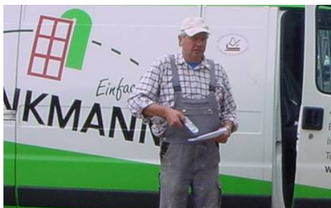
Stundenzettel adé! Jetzt buchen alle Brinkmann-Monteure ihre Arbeitszeiten und Aufträge mit dem mobilen Gerät Timeboy III.