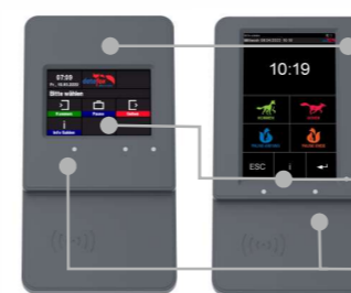
EVO 3.5 Pure EVO 5.0 Pure

Hochwertiges, strapazierfähiges Kunststoffgehäuse (IP54) High quality, durable plastic housing (IP54)